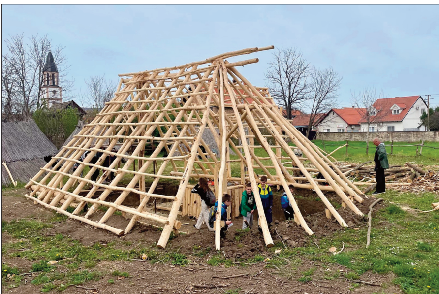
ГРАДИМО, стрпљиво и постојано: двориште музеја