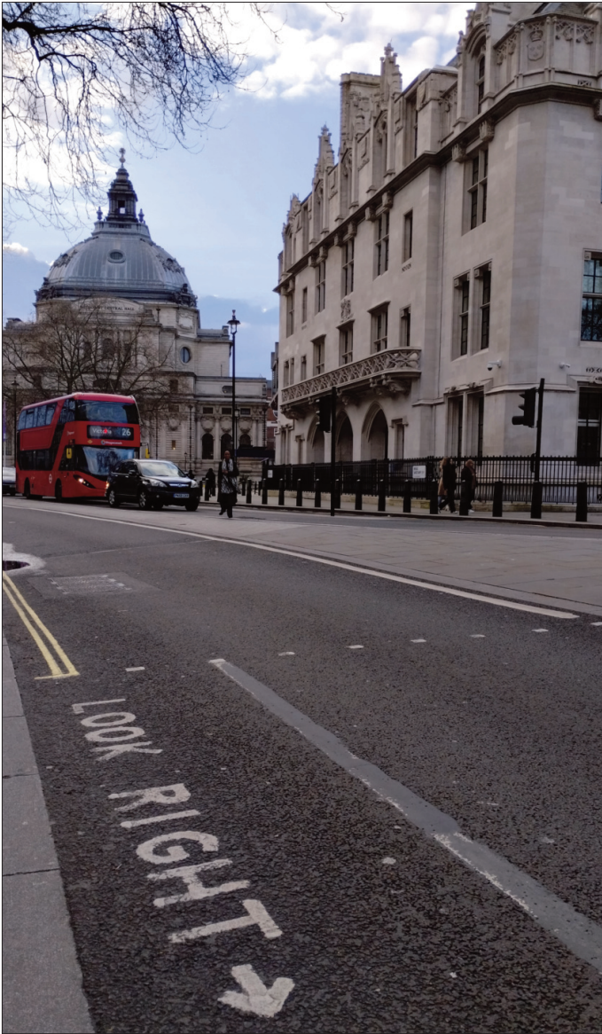
Саобраћајница: прати стрелицу!

шест до 12 особа у зависности од сезоне. Обезбеђење које чува ред, особе које на платформи деле шалове и чаробњачке штације и асистирају у фотографисању, особе које фотографишу, продају и израђују фотографије, неки су од запослених које ту можете свакодневно видети. Интересантно у овоме је што ви можете платити шест фунти (око 820 динара), да добијете фотографију, али и не морате. Можете добити максималну услугу у виду коришћења реквизита, и асистенције у намештању поза, потпуно бесплатно и то без пожуривања или негодовања, а фотографишући се сопственим телефоном. Разлог томе може бити што ширење брэнда има свакако своју цену, а задовољни обожаваоци су свакако брэнд.