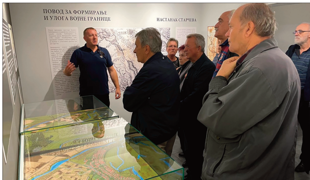
Београђани и Новосађани, чести су посетиоци старчевачког музеја

Одржавају се четири фестивала: пролећни је фестивал књиге и организује се током априла. Летњи фестивал “Екс ЈУ рок фест“ организује се у августу, током