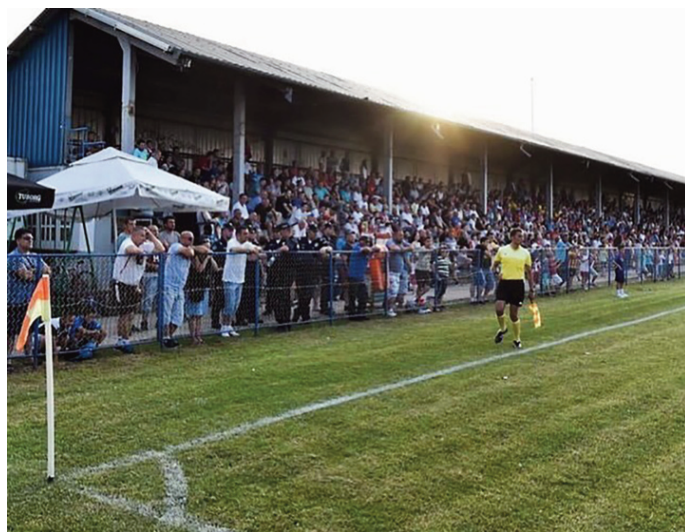
Општински стадион: место окупљања