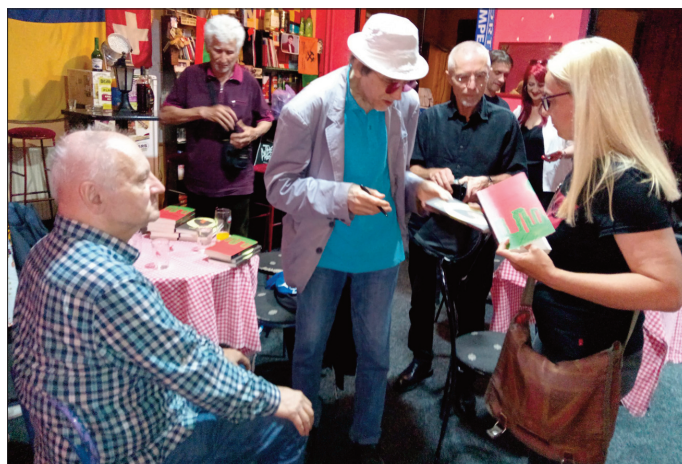
Тишма у Креативном културном клубу