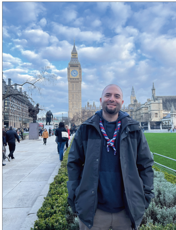
Марко на правом месту: Вестминстер и Биг Бен

Јавна безбедност је веома изражена и јасно уочљива. Свуда су ознаке упозорења, натписи и упутства шта се од вас очекује или на шта да обратите пажњу. “Опасност од вруће воде“ налази се код сваке славине у јавном простору. Натписи “погледај десно“ или “погледај лево“ налазе се на колешког код готово сваког пешачког прелаза. Ово су само неки од