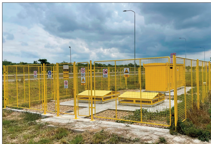
Мерно-регулациона станица: све је спремно

- “МТ Гастел“ ће, са друге стране, радити комплетан посао око прикључивања потрошача у сагласности и по процедурама “Србијгаса“, као и наплаћивати сагласно