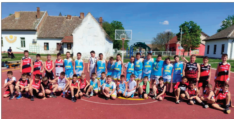
Младе наде старчевачке кошарке

У протеклом периоду одигране су три пријатељске утакмице најмлађих селекција Борца коју чине деца узраста од 1 до 4 разреда основне школе. Најпре је, 6 априла, КК Борац гостовао панчевачком Крис-кросу на отвореном терену "Исидорине" школе. Приказана је лепа игра са обе стране и велика борбеност. Истог дана у после подневним часовима у Омољници, најмлађи чланови, школица кошарке, одмерили снаге са КК-ом Младост. Било је много лепих потеза девојчица и дечака који ће тек показати шта знају. На крају, у недељу, 7. априла, Старчевци су угостили Крис-крос у утакмици која је одиграла на отвореном терену у дворишту Школе. Овом приликом испробан је и семафор који клуб од скоро поседује те се и знао резултат - 58:23 за Борац.