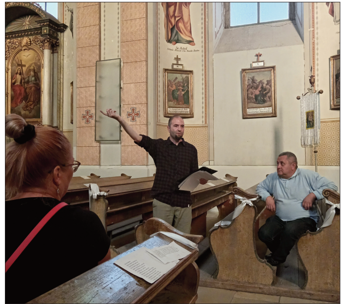
Упознавање са историјом