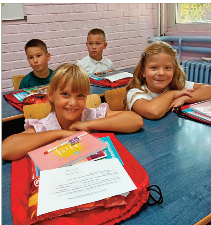
ДАНАС ПРВАЦИ - а биће и сутра прваци и шампиони