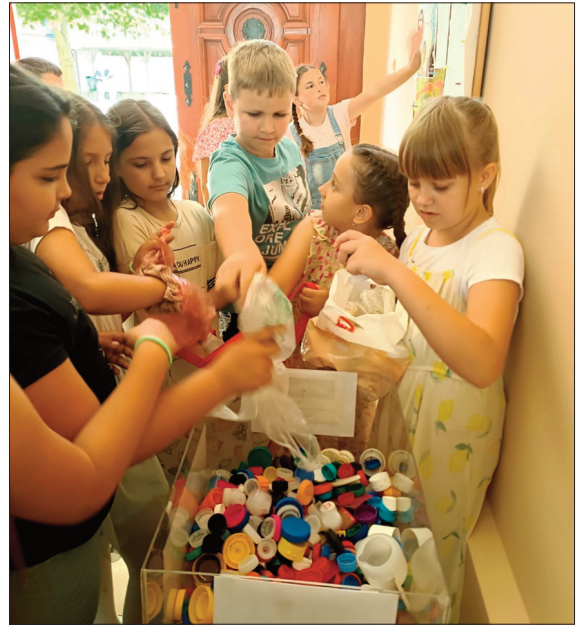
Одељење 3/2 рециклира

И тако су они почели да се друже. У једном тренутку су се запитали зашто се овај парк зове "Закопано благо"? Они су мислили да се зове "Закопано благо" зато што је овде негде скривено благо. Али пошто је парк био велики, морали су да нађу мапу. Договорили су се да морају да претраже сваки ћошак, сваку клупу и свако игралиште. Затим су се договорили ко ће где да тражи и када ће да се нађу, као и где. Свако је претражио свој део. Али, узалуд! Нису могли да нађу мапу. Али, Мики Маус види на дрвету нешто необично. И он се попе на то дрво да види шта је то. И то је била мапа. Па је Мики Маус викао: "Нашао сам. Нашао сам мапу"! Сви су се радовали томе. Хтели су одмах да крену али је било јако касно и морали су да спавају. Па су се договорили да крену рано у зору. Свануло је, и кренули су. Имали су четири задатка. Први задатак им је био да нађу Господина Кактуса Боцка Трећег. Како би им он дао други део мапе. Претражили су свуда и када су дошли на једно игралиште Мопс угледа Господина Кактуса Боцка Трећег. Мопс му је објаснио шта се дешава и он им је дао други део мапе. У другом делу је писало да морају на овом игралишту наћи крофну са пистаћима и лимуном. Али, пошто је игралиште било на тему крофни, било је тешко наћи ону праву. Мопс је у том тренутку имао око соколово, па је нашао крофну са пистаћима и лимуном. Мало су