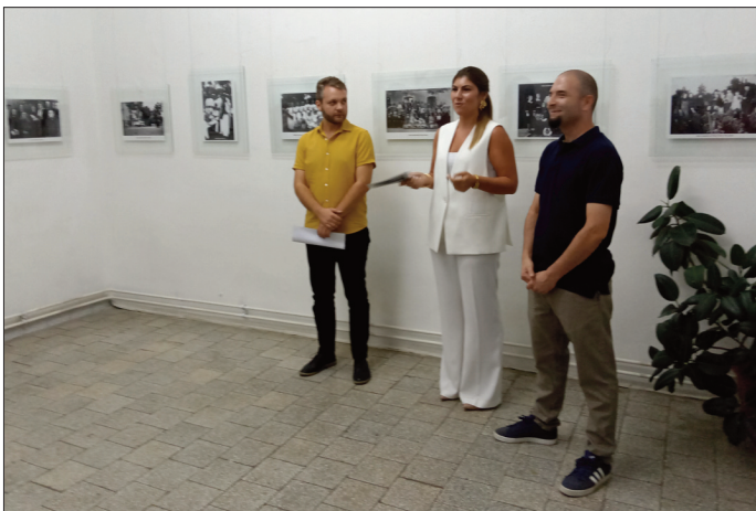
Са отварања изложбе