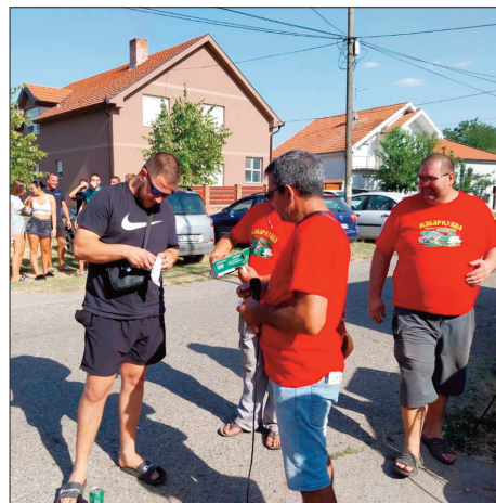
Први, други и трећепласирани кулinary

што су “жабари” учествовали на многим манифестацијама овога типа па је стога било и за очекивати велики број такмичара. Треба додати да су старчевачки “жабари” недавно освојили прва места на такмичењима у припреми рибље чорбе у Омољци и у Иванову. Поред домаћих такмичара, из Старчева и осталих места са територије града Панчева, учесници су били и из места суседних општина, а највише из Гаја. Такмичење је завршено у поподневним часовима, али је сама манифестација трајала до касно у ноћ.