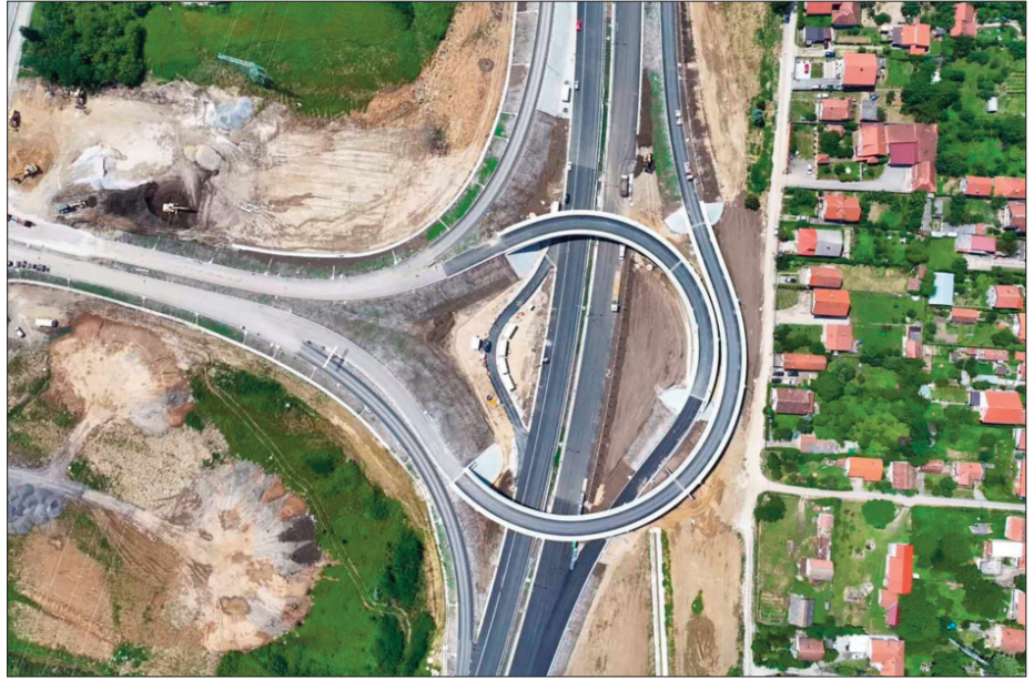
На аутопут Старчевци ће се укључивати са петље у рит

Део обилазнице око Београда од Стражевице до Бубањ Потока отворен је за саобраћај крајем јуна прошле године. Тада је са Саобраћајним институтом ЦИП потисан уговор за пројектовање наставка