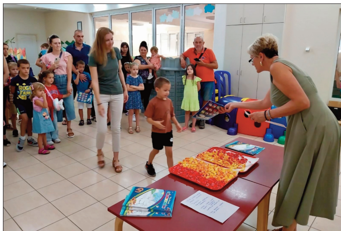
Први дан у вртићу