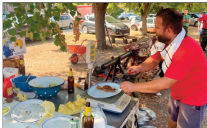
Добро се пило, добро се јело