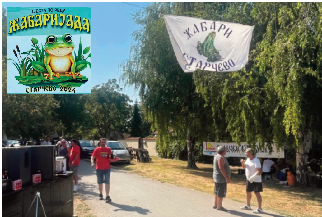
Добродошли у “жабарски” крај!