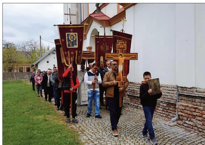
Храм Св. Пантелејмона (фотографија горе) и црква Св. Мауриција (доле)