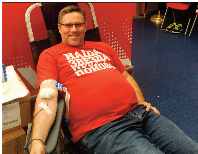
Циги - хуманост на делу