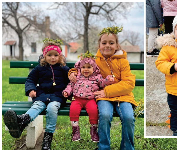
ВРБИЦА и дечица