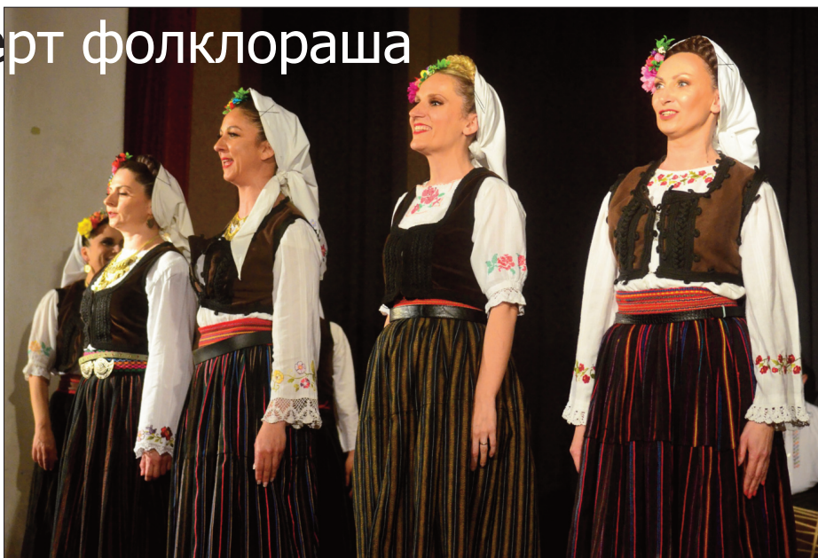
Наступ ветерана КУД-а Неолит

- На њихову иницијативу почели смо са радом пре неколико месеци и већ смо успели да спремимо две кореографије,