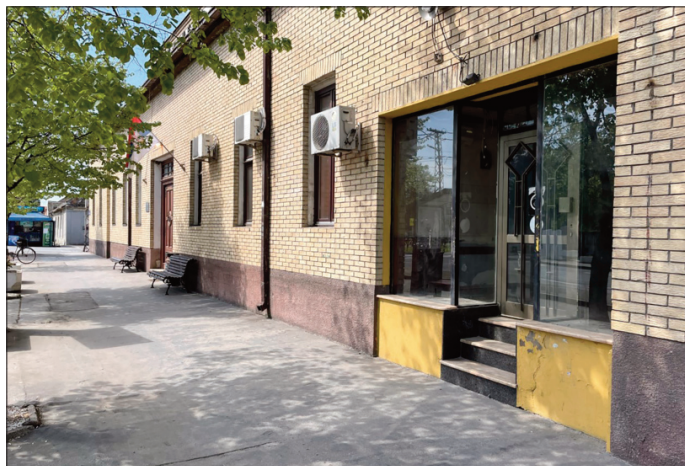
Ускоро нови јавни простор

Месна заједница Старчево дуже време тражи од Града средства за реконструкцију и адаптацију овог простора, а ова молба је коначно услишена. Садашње руководство Града Панчева позитивно је оценило ову иницијативу па су одобрена средства којима би се овај јавни простор привео намени - а то је да служи свим грађанима Старчева. У наредних неколико недеља спровеће се неопходни радови, а током маја овај простор би могао да прими и прве кориснике, старчевачке пензионере и активисткиње локалног удружења жена.