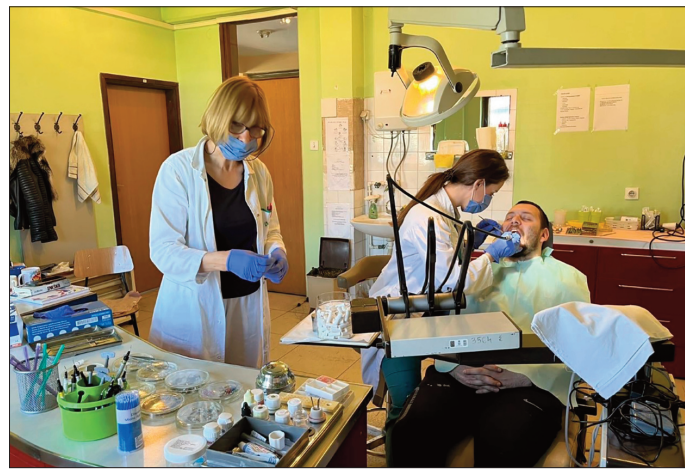
Стоматолошка амбуланта у Старчеву

Током пандемије коронавируса једна од првих мера је била затварање стоматолошких амбуланти у насељеним местима. Прошле године у априлу је у нашем месту поново почела са радом зубарска ординација али са непотпуним радним временом док је од почетка ове године стоматолошка клиника у пуном радном времену и прилагођена свим категоријама грађана. Понедељком, средом и петком амбуланта ради у преподневној а уторком и четвртком у поподневној смени.