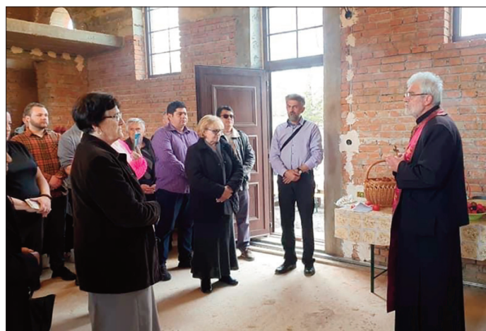
Ускрс у Храму Огњене Марије