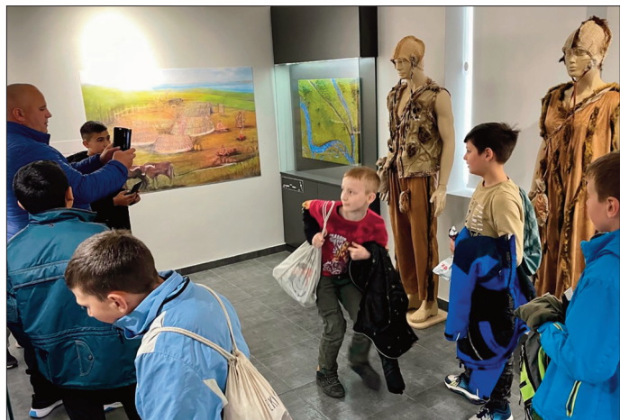
Ученици из Долова научили су много о старчевачкој историји

су сталну едукативно-изложбено поставку "Старчево кроз векове", изложбу старих разгледница, поставку пољопривредних алата и машина и реплику неолитског насеља у дворишту нашег музеја. За њих је организован и обилазак знаменитости на Тргу неолита и у центру Старчева уз пратњу водича. Деца су показала велико интересовање за све што су видели и посебну жељу да много тога фотографишу.