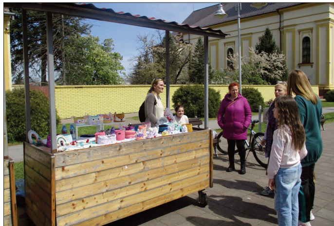
Базар на Тргу неолита