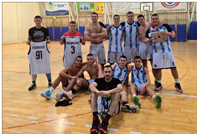
Кошаркашки клуб Старчево

Трећа и уједно последња утакмица КК-а Старчево пред паузу била је против Казабланке, која заузима последње место на табели. То је био прави тренутак да се одморе носиоци игре у домаћем тиму и да млађи играчи добију нешто више минута на терену. Тим из нашег места је имао додатни "ветар у леђа" од стране навијача који редовно подржавају тим, па је славио у овом сусрету с резултатом 66:54.