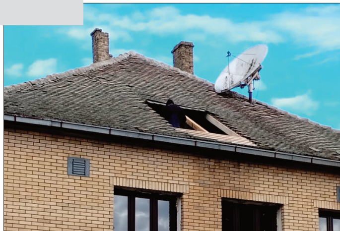
Безбедно за све

Током децембра месеца рађене су и две интервенције на санирању дотраја-