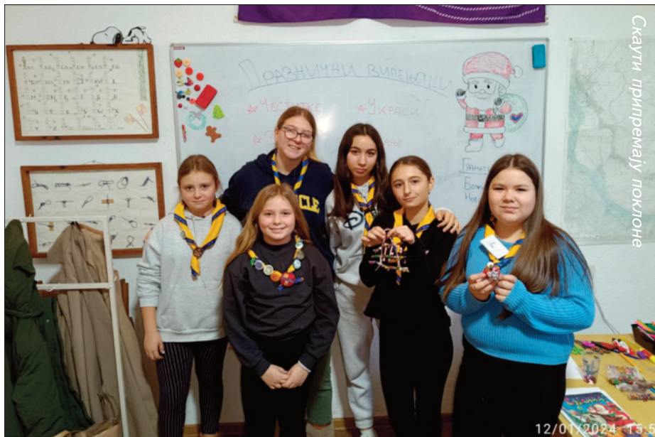
Скаути припремају поклоне

Пред крај новембра месеца је организована посета ватрогасној јединици Панчева, где су извиђачи имали прилику да се упознају са функционисањем ове службе. Кроз интерактивне радионице, сазнали су како функционишу апарати за гашење ватре, који су њихови основни делови и како их правилно користити у хитним ситуацијама. Учествовали су у вежби са ватрогасним цревом где су се упознали са техникама управљања водом под притиском, што им је омогућило да кроз практичан рад савладају основе важних вештина везаних за гашење пожара. Током посете извиђачи су имали прилику да виде