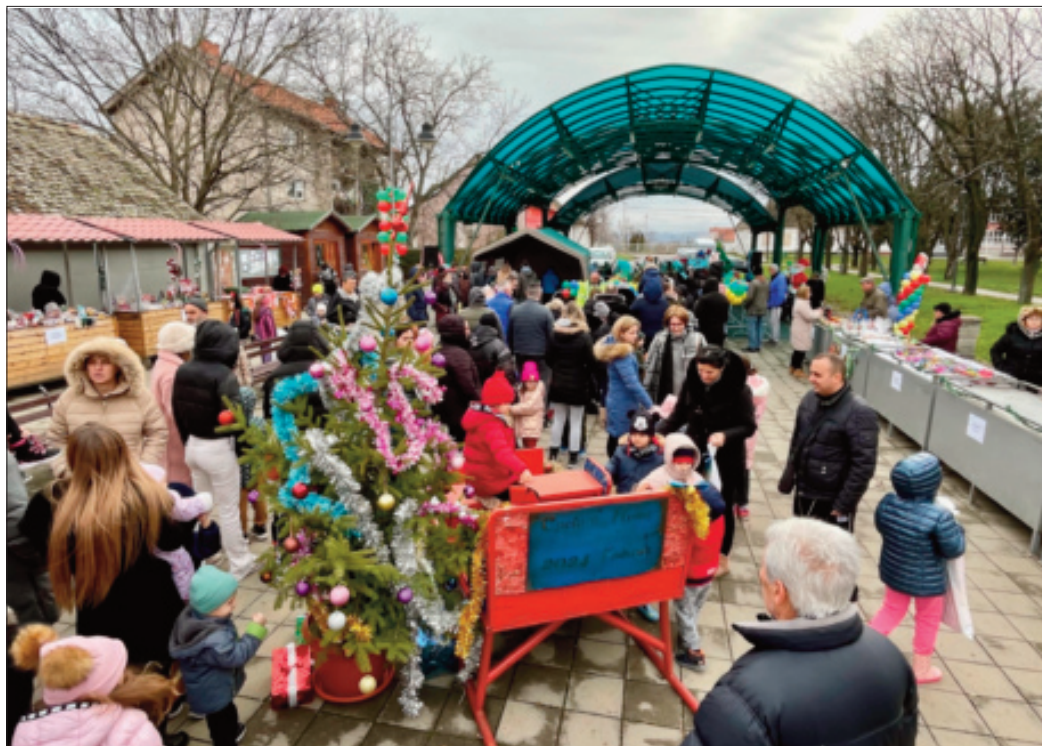
Једна лепа зимска субота на Тргу неолита

У петак, 27. децембра, Старчевци су имали прилику да на Тргу неолита, уз послужење и музику, уживају у целовечерњем дружењу под називом "Загревање".