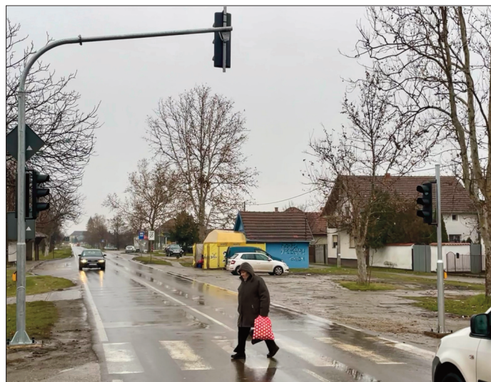
Од сада много безбедније

Деоница "код Лолинице" на Панчевачком путу, "кичми" саобраћаја у нашем месту, саобраћајна је "црна тачка". Пролетос, на састанку Комитета за безбедност саобраћаја који је одржан на иницијативу МЗ Старчево, расправљало се о овом проблему и донета је и одлука да на овој локацији буде постављен семафор. Ових дана изводе се радови на семафоризацији.