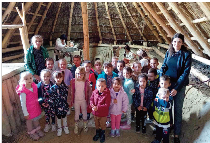
Школарци у старчевачком музеју

Радове ученика ОШ "Вук Стефановић Караџић" можете погледати и на интернет страници "Старчевачких новина" на адреси