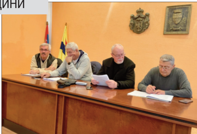
Стојић са сарадницима

Удружење најстаријих Старчеваца активно учествује у реализацији хуманитарних акција, а својим члановима пружа и различите погодности, попут бесплатног