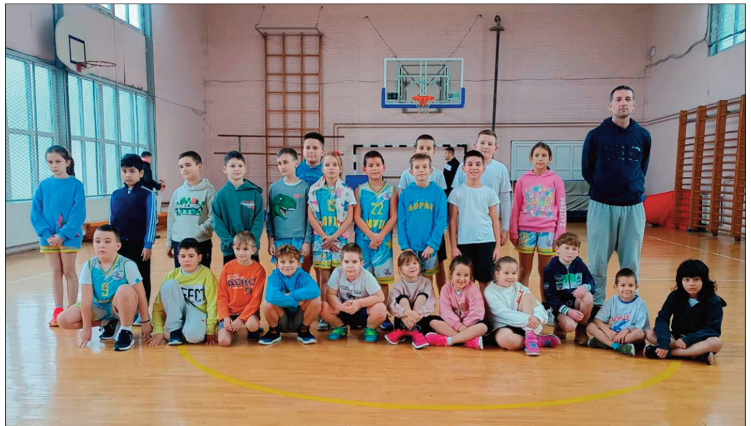
Кошаркаши и кошаркашице Борца

Потом су, 14. децембра, Старчевци угостили панчевачки КК Виртус баскет.