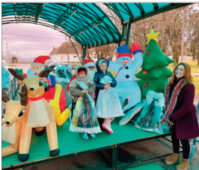
Деда Мраз с помоћницама обрадовао је децу