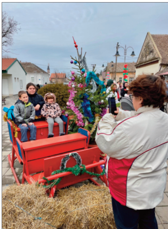
ДЕЦА јесу украс света. Ал' мора и мама да се слуша