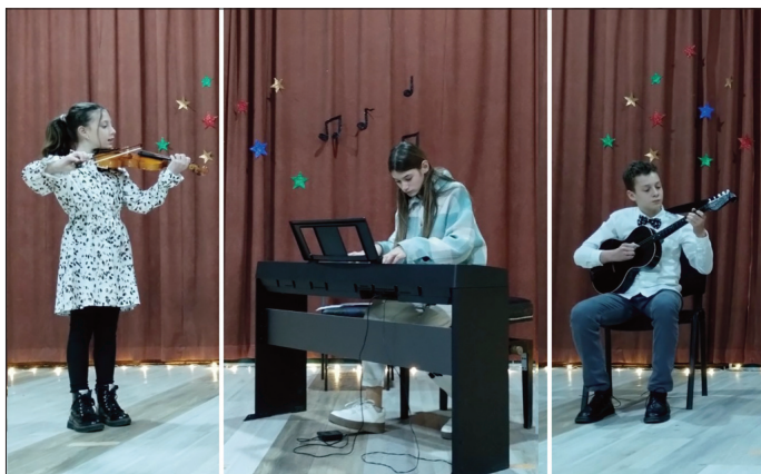
Наступ пред бројном публиком