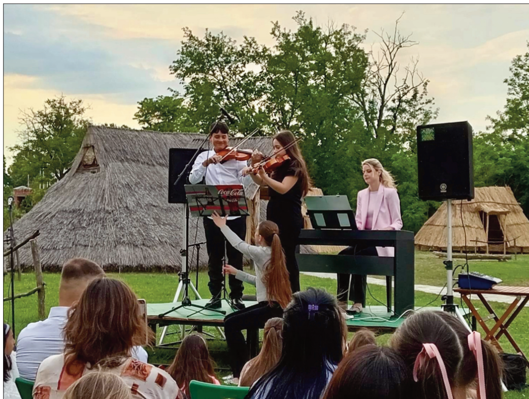
Ноте ове године у посебном амбијенту