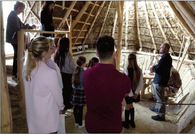
У неолитској кући

своја врата за посетиоце отвори у вечерњем термину, од 19 до 23 часа, а посетиоце је дочекивао и кроз поставке водио водич одевен у неолитску одећу. Тада су посетиоци могли да обиђу сталну поставку “Старчево кроз векове”, и две пратеће изложбе, а у дворишту музеја реплику неолитског насеља која оставља посебан утисак у вечерњим сатима и уз залазак сунца. Тада је на отвореном простору емитована и видео-пројекција неколико кратких филмова о старчевачкој култури.