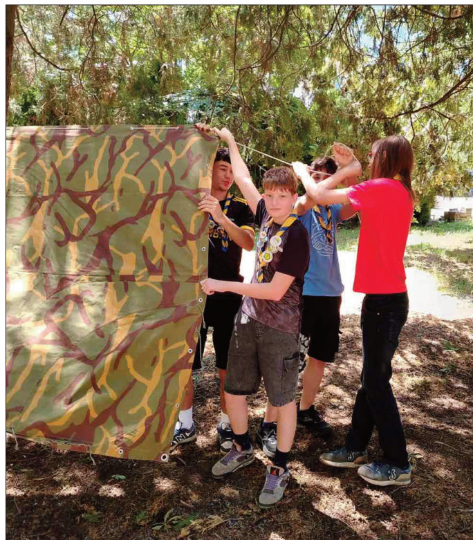
Како подићи шатор

Последњег дана маја старији извиђачи су, уместо редовног састанка, организовали дружење и купање на Ковинском језеру. Ово окупљање било је прилика да се након бројних активности мало опусте и проведу време у неформалној атмосфери. Поред дружења и рекреације, разговарали су и о плановима за наредни период, осмишљавали нове активности за млађе чланове одреда и размењивали идеје које ће допринети још квалитетнијем раду у будућности. На састанцима током јуна млађи скаути су показали завидне вештине у прављењу склоништа. Кроз практичан рад учили су како да користе доступне природне материјале, како да сарађују у тиму и како да планирају изградњу заклона.