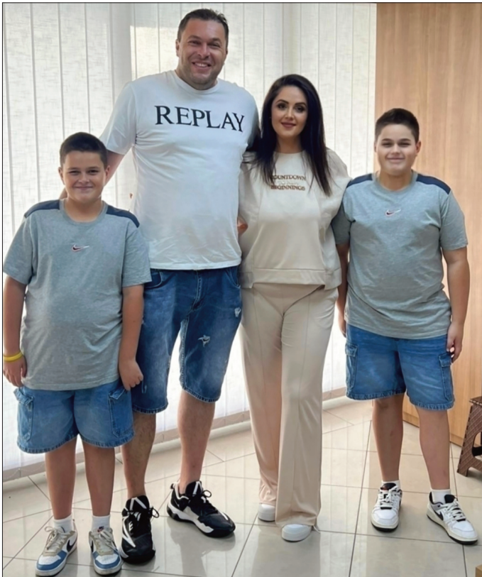
Славица са породицом