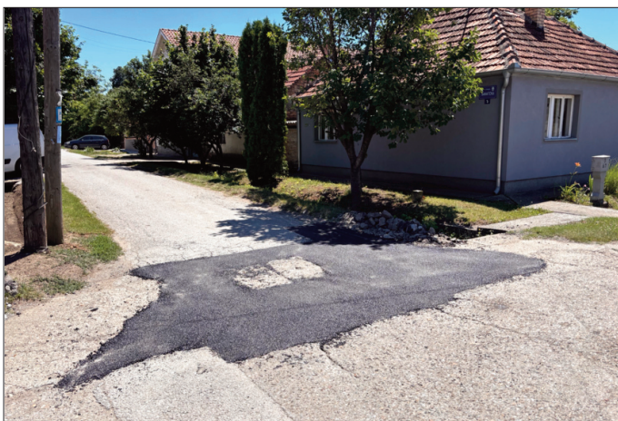
Угао Радничке и Банатске улице