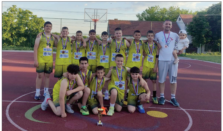
У врху војвођанске кошарке

□ ОДБОЈКА / ОК Борац привео је крају такмичарску сезону 2025/26 у оквиру Друге лиге Север, зауевши шесту позицију на табели. Након прошлогодишњег болног испадања из вишег ранга, Старчевци су се ове године консолидовали и уз помоћ играча из сопственог погона успели да одрже жар старчевачке одбојке. Екипа је у 20 одиграних кола забележила половичан учинак - остварено је тачно 10 победа и 10 пораза, што је било довољно за сакупљање 31 бода. Иако је примарни циљ био стабилизација сениорског тима, управа клуба и навијачи имају много разлога за оптимизам. Поред солидног издања првог тима огроман успех направила је јуниорска скипа Борца која се преко узбудљивог баража пласирала на државно првенство.