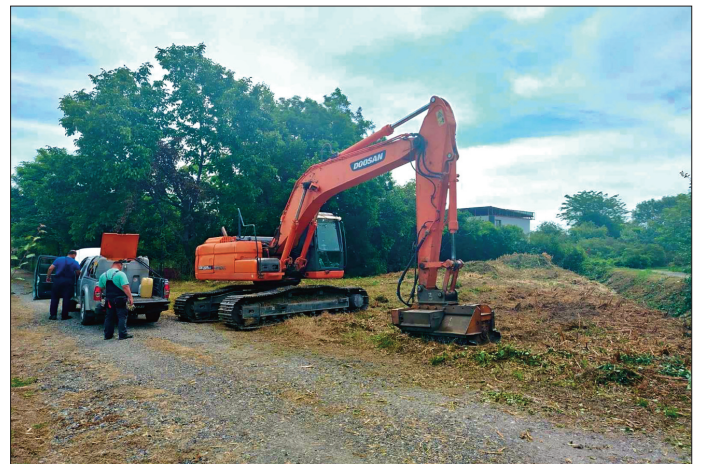
Кошење канала у Утринској улици