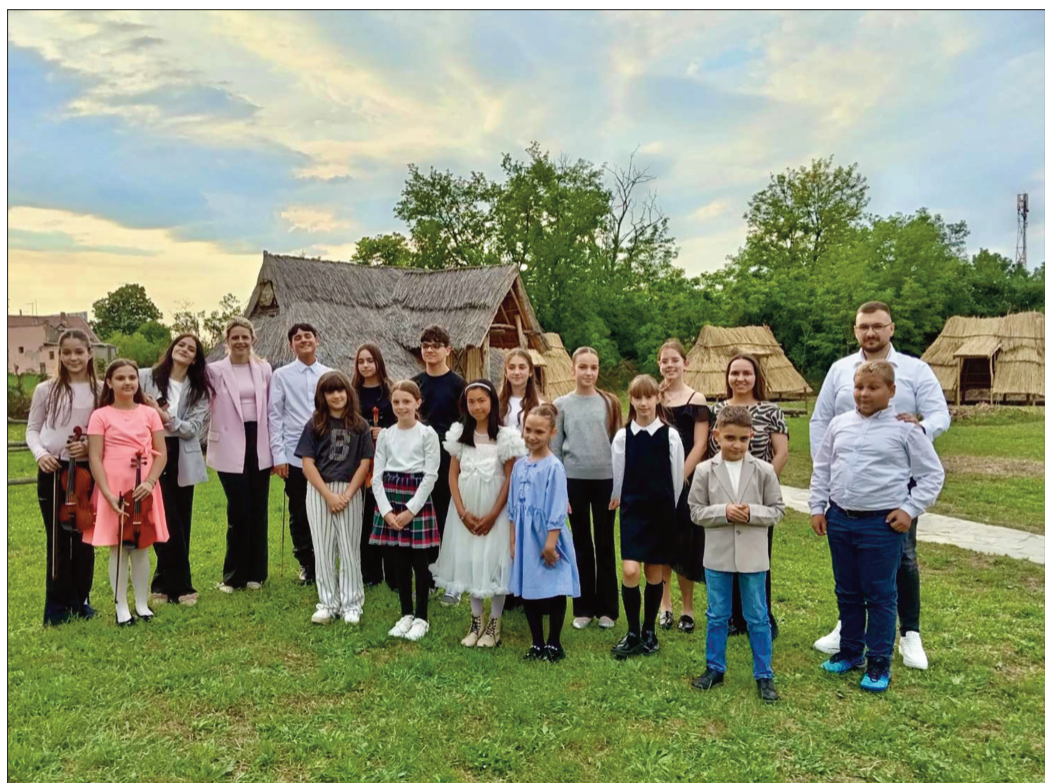
Ученици издвојеног одељења Музичке школе

струкција рађена током овог пролећа уз подршку Града Панчева, Месне заједнице Старчево и удружења “Пагус”. Другог дана манифестације старчевачки музеј је