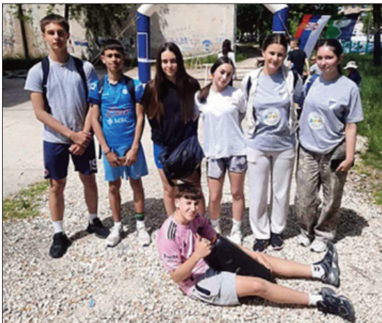
Старчевци у Бору

Након одржаног школског такмичења у оријентирингу на коме је учествовало 49 екипа са по три члана од петог до осмог разреда, најбољи такмичари су учествовали и на државном школском такмичењу у оријентирингу које је одржано 15. маја у Бору, на коме је учествовало више од 300 учесника. Такмичење је било појединачно, одржавало се у центру града, у парку и околини, и сви наши такмичари, њих седморо, успешно су прошли трасу - за девојчице 15, а за дечаке 16 контролних тачака.