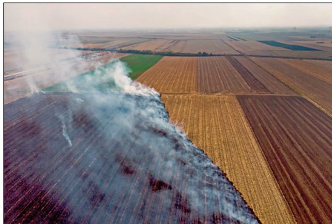
Да не буде овако

У периоду сазревања и за време жетве забрањено је паљење и употреба отворене ватре у близини усева. Жетва и транспорт стрних усева и сламе може се обављати технички исправним пољопривредним машинама и транспортним средствима, уз услов да су снабдевени одговарајућим хватачима, разбијачима и пригушивачима варница. Комбајни којима се обавља жетва морају бити снабдевени исправним апаратом за гашење пожара, ашовом и лопатом. При обављању жетве и превоза стрних усева и камарица сламе забрањено је пушење и коришћење средстава са отвореним пламеном.