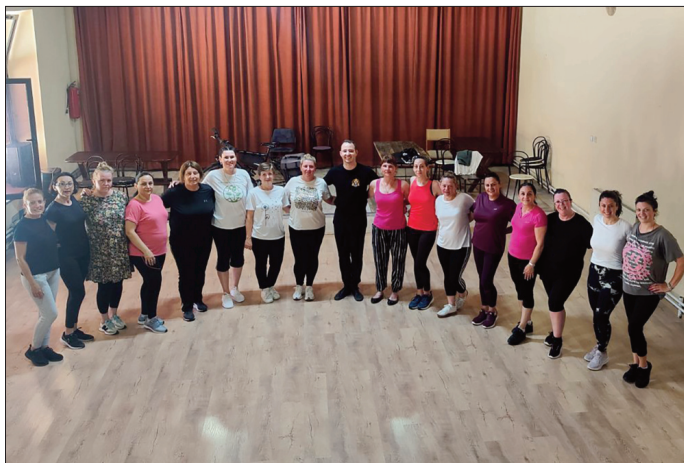
Фолклораши - рекреативци

Културно-уметничко друштво "Неолит" наставило је са бројним активностима и током јуна, потврђујући још једном да је место окупљања свих генерација које повезује љубав према фолклору, традицији и заједништву.