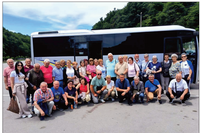
Уживање у путовањима

Касно поподне кренули су ка Старчеву. Пут је протекло безбедно и дошли су у наше место раздрагани и расположени због лепо проведеног дана.