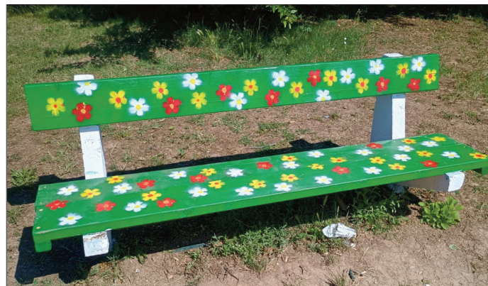
Све се може кад се комшије сложе - клупе код дисконта

Та обавеза траје све до данас. Ништа се ту није променило. А тако и треба да буде - јер ко ће најбоље чувати и бринути о игралишту од самих мештана из комшилука!