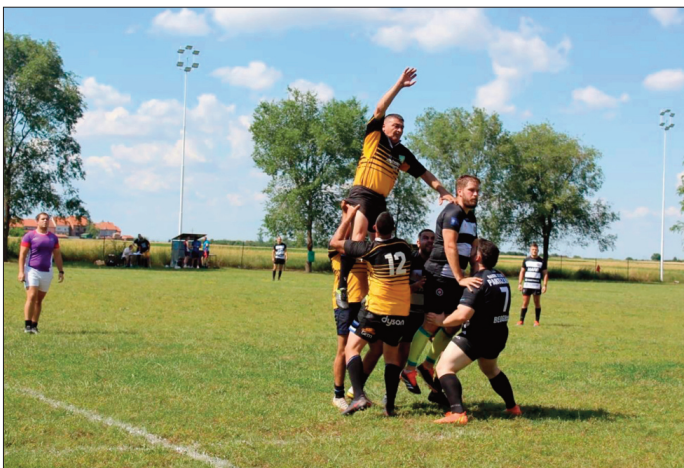
Рагби је интересантна игра

Током овог месеца рагбисти старчевачког Борца били су домаћини два значајна турнира у "рагбију 7" - турнира за сениоре и за кадете. Оба догађаја протекла су у одличној организацији, сјајној атмосфери и уз велики труд свих људи укључених у реализацију.