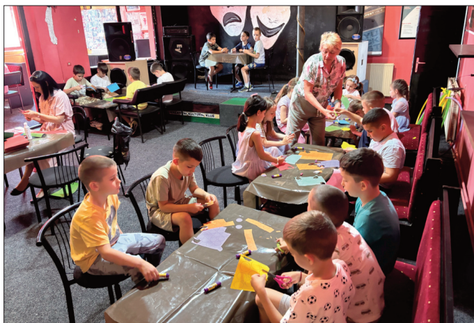
Вредне дечије руке