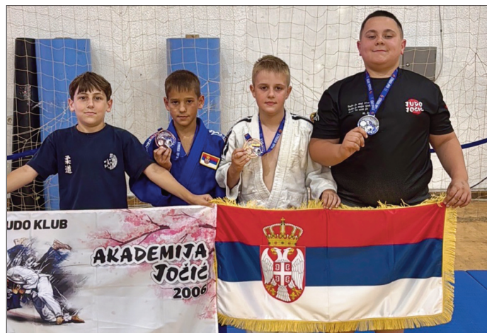
Успешни у Северној Македонији