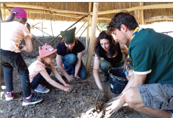
Примењена археолошка знања