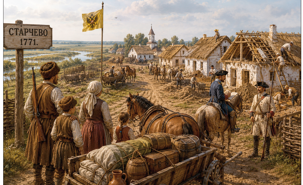
Долазак граничара (илустрација)

Село није било велико, али је живело. Из дворишта се чуо лавез паси, негде је рзнуо коњ, а са једне куће одјекивали су ударци чекића. Градило се на све