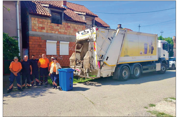
Екипа Хигијене на терену