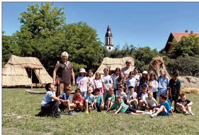
Ученици београдских школа

На крају, бележимо и организовану посету иностраних гостију, најпре из Вараждина (Хрватска), а потом и једне групе Румуна, заљубљеника у археологију. Бележи се и повећан број појединачних посета током јуна међу којима неретко буде и иностраних туриста. Наравно, чести гости су и Старчеваци који, пак, своје госте доводе у музеј историје Старчева.