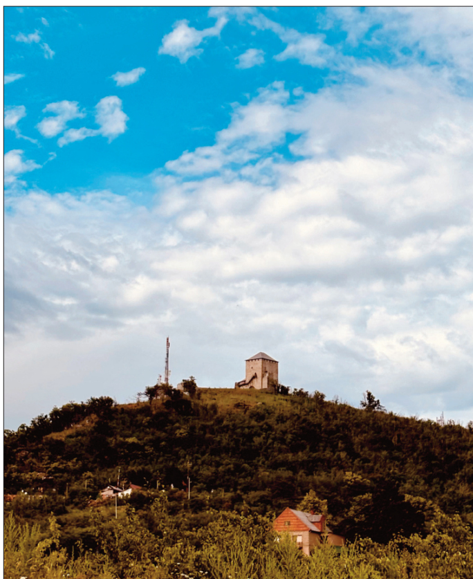
Кула - магична привлачност Вршачких планина

□ Вршачке планине представљају највиши и најстарији планински масив у Војводини. Настале су пре више десетина милиона година, а некада су, као каменито острво, вириле изнад вода Панонског мора. Данас се њихови шумовити обронци уздижу изнад банатске равнице и пружају јединствене видиковце са којих се, за ведрих дана, поглед простире далеко преко Србије и Румуније. Највиши врх, Гудурички врх, достиже 641 метар надморске висине и представља највишу тачку Војводине.