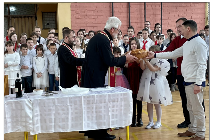
Свети Сава - школска слава