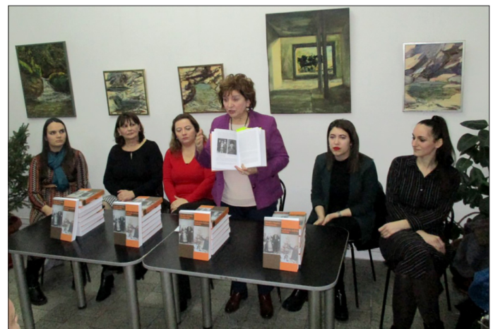
Традиција и култура