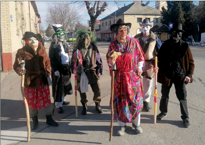
Традиција је злата вредна