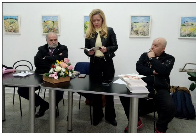
Са једног од књижевних догађаја