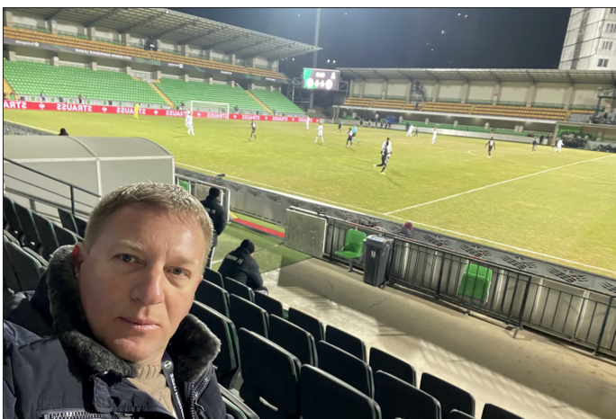
Зимбру арена без публике