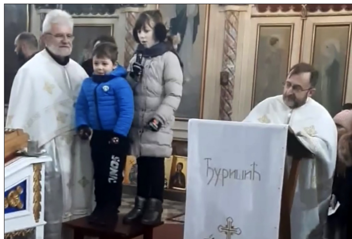
На светог Саву

Велики ускршњи пост почео је у понедељак, 27. фебруара. Пост у православном хришћанству представља уздржавање од одређене врсте хране (“мрсне“), као и од сваког облика грешних дела, помисли и жеља. Поред молитве, и свега што служи духовном животу, црквени оци приписују посту нарочиту важност. Пост је средство које православном хришћанину помаже у изградњи спасења, а које се састоји у уздржавању од извесне врсте хране, од рђавих мисли, жеља и дела, као и у умножавању молитава, добротина, а исто тако и у ревности упражњавања свих хришћанских врлина. Циљ поста је очишћење тела, јачање воље, уздизање душе изнад тела, а изнад свега прослављање Бога и поштовање његових светих. Постећи, православни верни народ се непрекидно подсећа Христових страдања, које је Он благоизволео примити на Себе, за спасење човечанства.