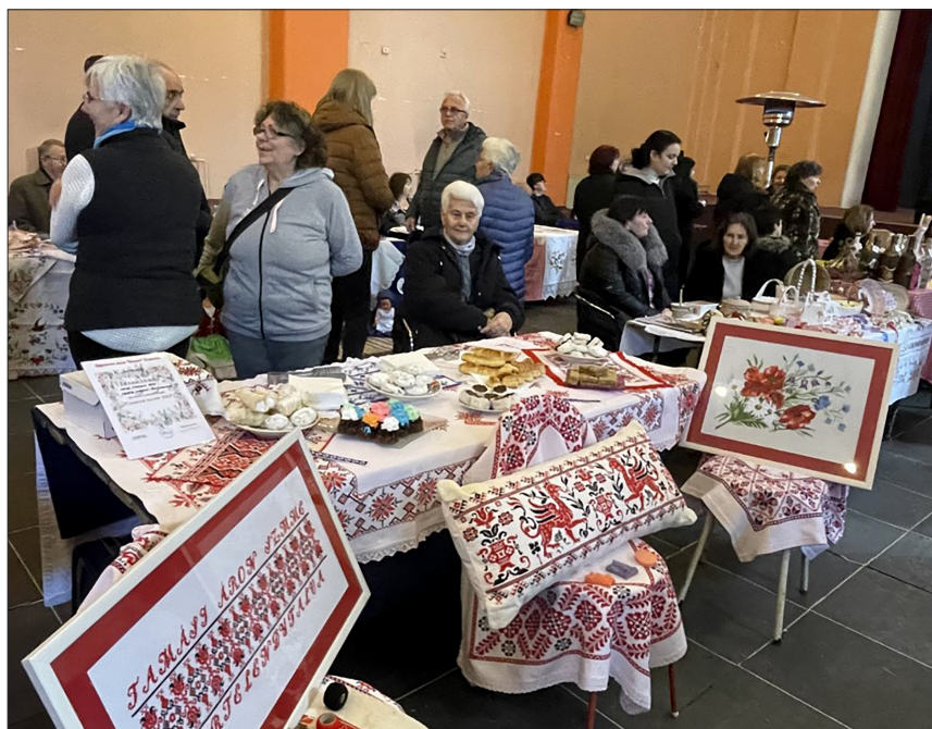
ШТАНДОВИ: Лепо је када има шта да се покаже