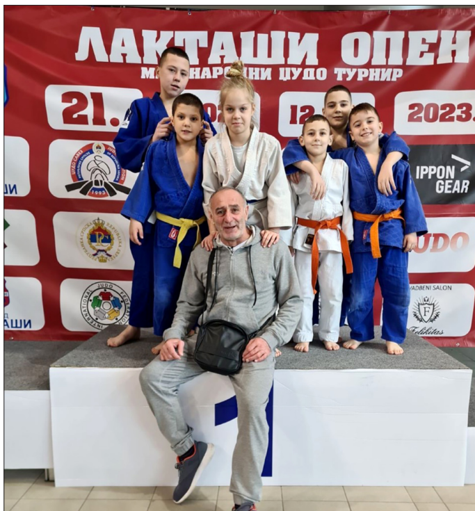
Академци у Лакташима

Џудо клуб “Академија Јочић” протеклог викенда боравио је у Лакташима, граду у Републици Српској двадесетак километара удаљеном од Бањалуке. На овом месту се окупило безмало хиљду такмичара из осам држава и са преко 50 џудо клубова. “Академија Јочић” је на овом турниру учествовала са скромном делегацијом од шест такмичара. Разлог малог броја