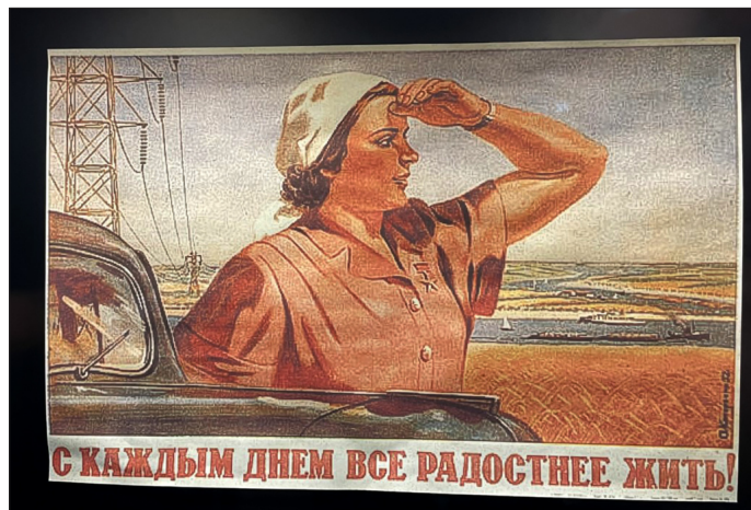
Национални музеј памти истине и заблуде

Молдавски фудбал је на европском зачељу. И репрезентативни, а и клубски. Просек вади тираспољски "Шериф", иначе стациониран у отцепљеном делу Молдавије, у Придњестровљу.